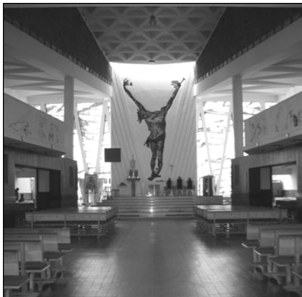
Fot. 9. Wnętrze kościoła p.w. św. Jana Chrzciciela w Tychach.

kościół początkowo nie odpowiadała dużej liczbie wiernych, którzy byli przyzwyczajeni do tradycyjnego stylu i wystroju wnętrza, a widok namalowanego Ukrzyżowanego Chrystusa na ścianie ołtarzowej wciąż jest przedmiotem kontrowersyjnych opinii (fot. 9). Tuż przy kościele, w 1981 r. wybudowano wieżę w kształcie krzyża, w której umieszczono trzy dzwony. W kościele znajdują się dwa witraże. Pierwszy – znajdujący się za ścianą ołtarzową – został wykonany w 1989 r.; drugi – znajduje się w ścianie frontowej i przedstawia m.in. sceny chrztu w Jordanie. W kościele warto również zwrócić uwagę na nietypowe stacje Drogi Krzyżowej.