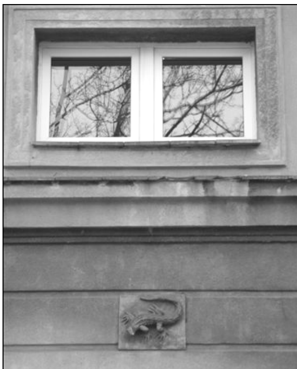
Fot. 5. Plakieta zoomorficzna. Photo 5. Zoomorphic Plaque.