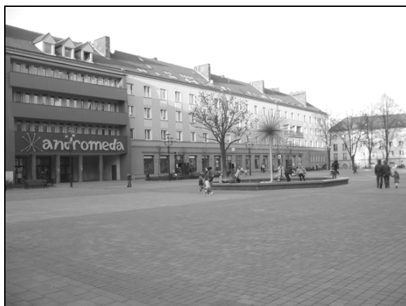
Fot. 7. Odnowiony Plac Baczyńskiego – widok na pierzeję południowo-wschodnią. Photo 7. Renovated Baczynskiego Square – South-East Frontage View.

Osiedle „B” (Barbara) – budowę tego osiedla rozpoczęto w 1953 r. Według koncepcji generalnych projektantów osiedle B miało być łącznikiem nowego miasta z zastanym starym zespołem miasteczka Tychy. Wejchertowie nazwali to osiedle romantycznym. Ulice zostały poprowadzone swobodnymi liniami, dostosowanymi do ukształtowania terenu, z kilku miejsc otwarto perspektywę na wieżę barokowego kościoła p.w. św. Marii Magdaleny. Przed kościołem znajduje się rynek, który został utworzony po 1959 r. Do około 1920 r. znajdował się tam staw. W 2007 r. na rynku postawiono fontannę, w pobliżu której rosną trzy lipy, posadzone w latach 60. XX w. dla upamiętnienia trzech powstań śląskich (Lipok-Bierwiazzonek, 2011). Symbolem przypominającym o dawnym wiejskim charakterze tego terenu jest rzeźba „Chłopcy z gęsią” (odnowiona w 2010 r.), znajdująca się na skwerze u zbiegu ulic Budowlanych i Batorego. Będąc na tym osiedlu warto również zobaczyć odnowiony Plac Baczyńskiego (fot. 7-8). Udając się z Placu Baczyńskiego w stronę osiedla „E” (Ewa) dojdziemy do Parku Niedźwiadków, w którym znajdują się trzy rzeźby niedźwiadków w różnych pozach – ulubione miejsce zabaw dzieci. W parku tym znajduje się również fontanna, która ma postać spiętrzonych mis o zróżnicowanej średnicy. Idąc dalej trasą linii trolejbusowej warto zwrócić uwagę na budynek Technikum Budowlanego (obecnie Zespół Szkół nr 5), a zwłaszcza na formę łupinową dachu nad wejściem do szkoły.