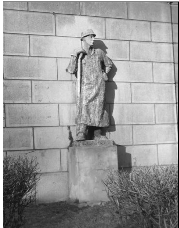
Fot. 2. Rzeźba hutnika.