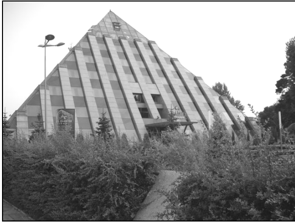
Fot. 11. Hotel Piramida w Tychach. Photo 11. Piramida Hotel in Tychy.