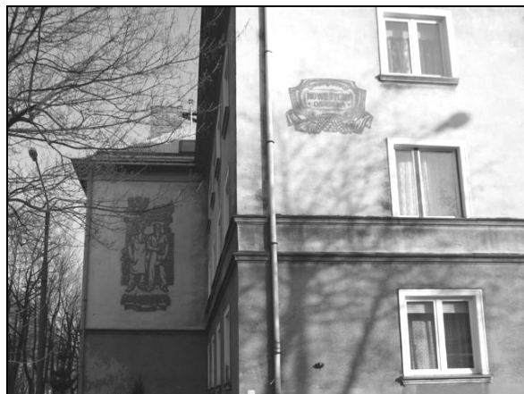
Fot. 4. Kompozycje wykonane techniką sgraffito.