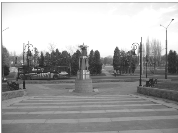
Fot. 3. Lampa górnicza w skali 10:1. Photo 3. Miner's Lamp, scaled 10:1.

z Warszawy, pracujący pod kierunkiem Kazimierza Wejcherta i Hanny Adamczewskiej (później Adamczewska-Wejchert). Zostali oni mianowani generalnymi projektantami miasta Tychy. Pierwszym osiedlem zrealizowanym według nowej koncepcji było osiedle B.