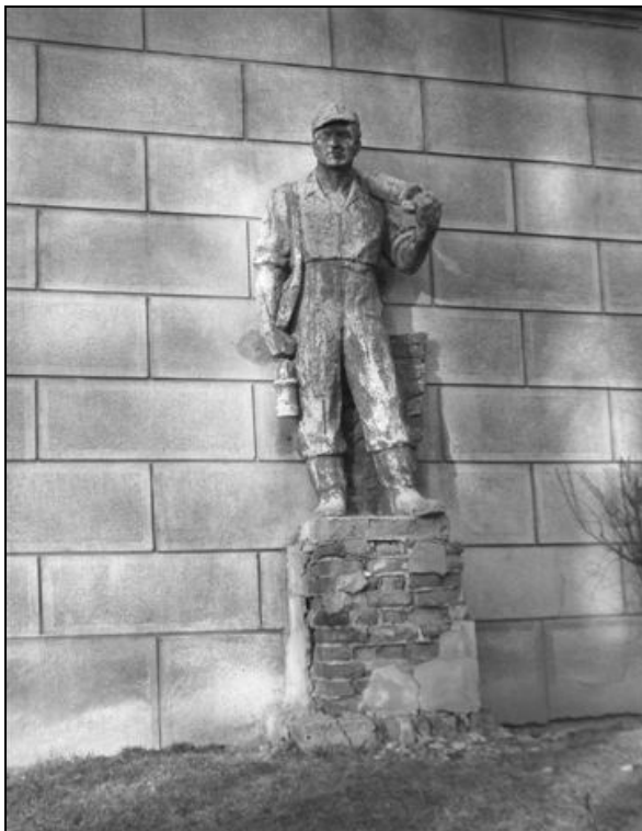
Fot. 1. Rzeźba górnika.