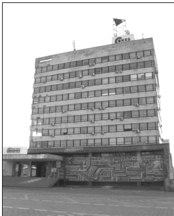
Fot. 6. Budynek ZEG-u z oryginalną mozaiką obwodów scalonych. Photo 6. ZEG Building with Original Integrated Circuit Mosaics.