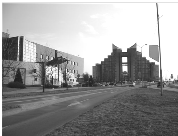
Fot. 10. Ikona Tychów – Brama Słońca . Photo 10. Tychy's Icon – the Gate of Sun.

Wysiadając przystanek dalej (jadąc trolejbusem w kierunku zajezdni) i udając się w kierunku osiedla „U” (Urszula) zobaczymy charakterystyczny i niepowtarzalny budynek w mieście – Bramę Słońca (fot. 10). Brama Słońca obok piwa tyskiego, fabryki samochodów „Fiat Auto Poland” oraz trolejbusów uważana jest za symbol Tychów. Obok Bramy Słońca znajduje się bank PKO, który jest charakterystycznym przykładem architektury postmodernistycznej.