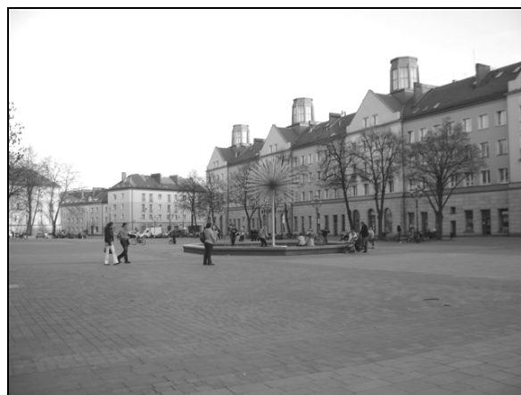
Fot. 8. Odnowiony Plac Baczyńskiego – widok na pierzeję północno-wschodnią. Photo 8. Renovated Baczynskiego Square – North-East Frontage View.

Osiedle „H” (Honorata) – na tym osiedlu ciekawym obiektem na trasie linii trolejbusowej jest kościół p.w. św. Jana Chrzciciela. Budowę kościoła rozpoczęto w sierpniu 1957 r., a poświęcono 21 grudnia 1958 r. ( www.tychyich.katowice.opoka.org.pl ). Przez około 15 lat kościół stał w szczerym polu, dopiero w 1973 r. zaczęto budować wokół niego osiedle H. Od samego początku nowoczesna architektura kościoła była przedmiotem dyskusji i licznych krytyk. Prostota i surowość stylu